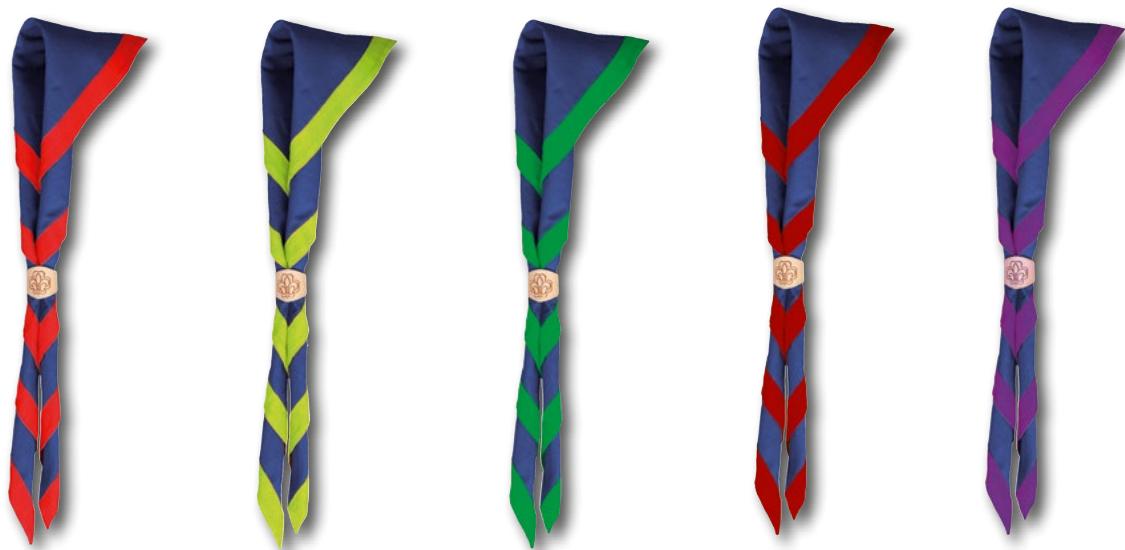
Abb. 2: Halstücher als Erkennungszeichen: blau mit orangerotem Rand für die Kinderstufe, blau mit hellgrünem Rand für Jungpfadfinderinnen und Jungpfadfinder, blau mit dunkelgrünem Rand für Pfadfinderinnen und Pfadfinder, blau mit bordeauxrotem Rand für Ranger und Rover, blau mit lila Rand für alle übrigen Mitglieder. (Trachtordnung des VCP)

oder Jugendlichen zunehmende Kompetenzen übertragen, was die wachsende Reife der Person nach innen und außen betont. Dem Kind oder Jugendlichen wird verdeutlicht, dass Pfadfinden in allen Lebensphasen weitergehende Angebote bietet, die auf die jeweiligen Bedürfnisse der Altersgruppe eingehen.