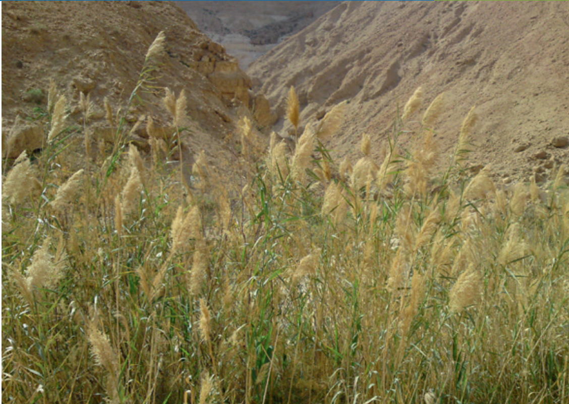
Wadi Mischmar, Israel