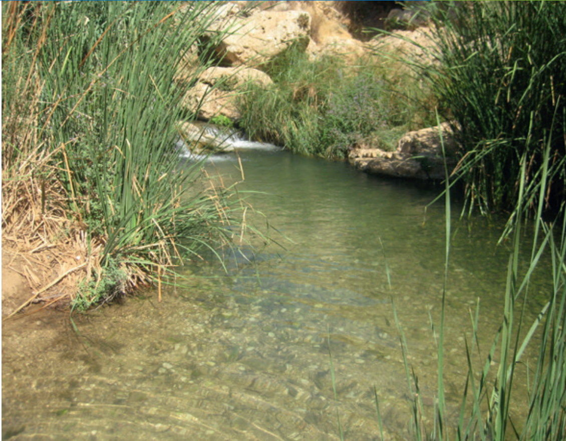
En Prat, Israel