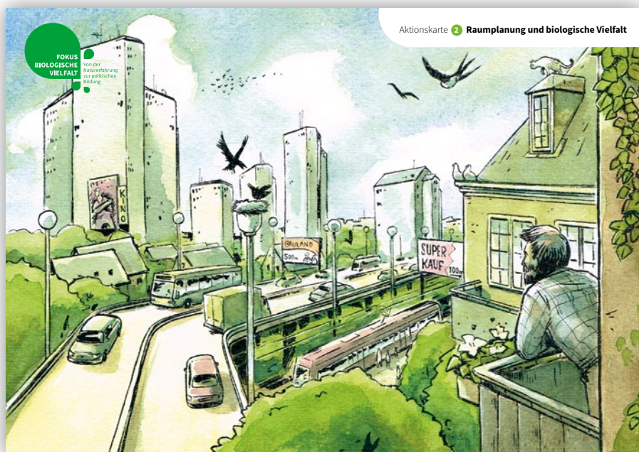
Aktionskarte 2 Raumplanung und biologische Vielfalt

Einstieg: Die Abbildung ist Diskussionsgrundlage: Welche Zusammenhänge mit der biologischen Vielfalt sind erkennbar? Welche Fakten und Erlebnisse fallen den Jugendlichen bei der Betrachtung ein?