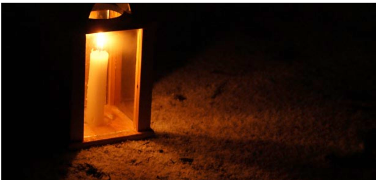
Abbildung 2: Lichterpfad im Schnee.

In vielen VCP-Gruppen, und durchaus auch solchen, in denen das »C« ansonsten keine allzu große Rolle spielt, ist es eine gute Tradition, als Helferin oder Helfer zum Kirchentag zu fahren und tatkräftig zum Gelingen dieser Großveranstaltung beizutragen. Dabei stellte der VCP bislang immer das größte Kontingent. Wenn man schon mal dort ist, sollte man auf jeden Fall auch