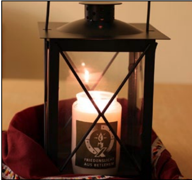
Abbildung 5: Ranger- und Rover verteilen im Advent das Friedenslicht aus Bethlehem.

Weitere Informationen unter www.taize.fr (Französisch-Kenntnisse sind nicht nötig!).