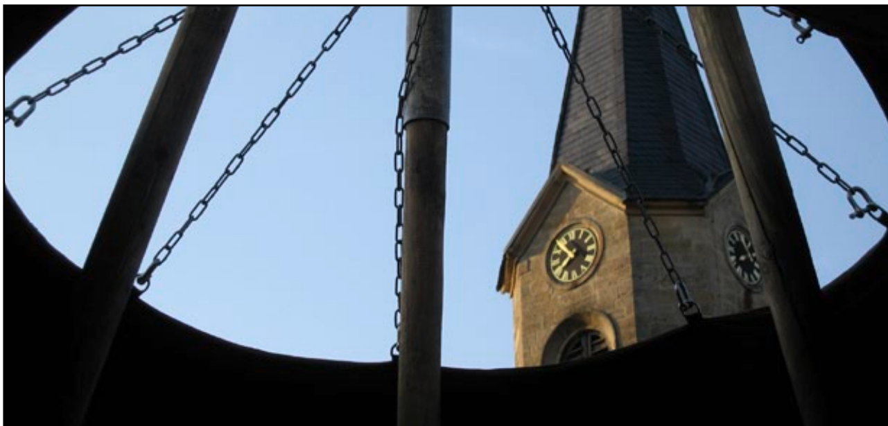
Abbildung 7: Pfadfinden und Glaubenswege gehen gehört im VCP zusammen.

nach dem Zweiten Weltkrieg zur evangelischen Ordensgemeinschaft Communität Casteller Ring zusammen. Die Gemeinschaft lebt nach der Regel des Heiligen Benedikt.