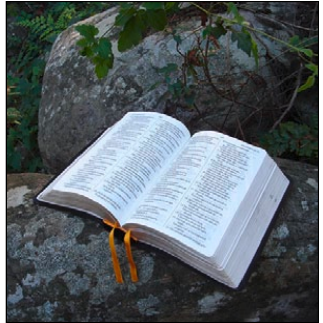
Abbildung 1: Ranger und Rover entdecken die Bibel für sich.

Oder wie wäre es mit einer neuen Kultur des Tischgebets? Häufig kommen in Gruppen immer wieder die gleichen Tischgebete und Lieder zum Einsatz. Eine andere Form sind frei formulierte Tischsprüche, in die die Ereignisse des Tages aufgenommen werden. Damit wird der Dank nicht mehr nur heruntergeleiert, sondern bewusst gesprochen – und alle im Kreis hören gespannt zu, um mitzubekommen, was wohl in den Spruch eingeflossen ist. Zum frei formulierten Tischgebet setzen sich alle in den Kreis. Nachdem sich eine freiwillige Person für das Gebet gemeldet hat, wird schweigend gewartet, bis diese ihren Spruch fertig formuliert hat. Natürlich können auch mehrere Ranger und