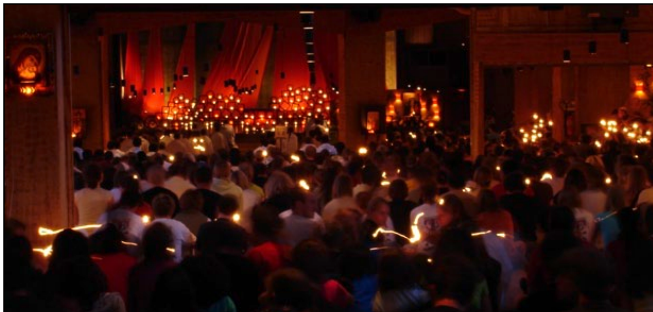
Abbildung 4: Abendgebet in der Versöhnungskirche von Taizé.

es auch helfen, sich mit der Geschichte des Weges vertraut zu machen. Welche Motivation haben und hatten die Pilger, die diesen Weg gehen und gegangen sind? Während der Fahrt schließlich sollte die Möglichkeit bestehen, sich über die inneren Erlebnisse austauschen zu können. Dabei kann der Tag mit regelmäßigen kurzen Morgenandachten zum Aufbruch, zum Mittag und zum Tagesausklang als Reflexion über die Etappen der eigenen Auseinandersetzung mit dem Glauben gestaltet werden. Impulse, die dabei hilfreich sein können finden sich in den in der Literaturliste im Anhang erwähnten Arbeitshilfen.