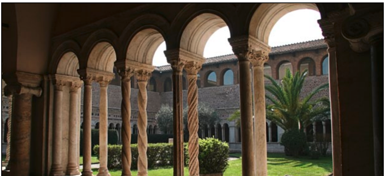
Abbildung 6: Im Kloster zu sich selbst kommen und seinem Glauben nachspüren.

Nach dem Zweiten Weltkrieg entwickelte sich in den Vorgängerbünden des VCP oft ein intensiv gelebtes geistliches Leben. Auf dem Nährboden dieser liturgischen Spiritualität entstand wiederholt die Überlegung, sich zu einem Orden zusammenzuschließen bzw. einer Ordensgemeinschaft anzuschließen. Im bayerischen Bund Christlicher Pfadfinderinnen (BCP), einem der Vorgängerbünde des VCP, verfolgten einige Pfadfinderinnen diese Idee nachdrücklich und schlossen sich kurz