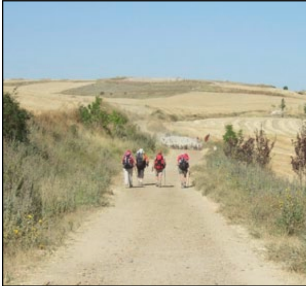
Abbildung 3: Ranger und Rover auf dem Jakobsweg nach Santiago de Compostela.

gestellungen, wenn sie in Zusammenhang mit einem aktuellen Thema (sei es aus den Nachrichten, sei es aus dem persönlichen Umfeld) gebracht werden können. Die im Anhang erwähnten Materialien können helfen, das richtige Thema für die Wache zu finden.