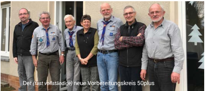
Der (fast vollständige) neue Vorbereitungskreis 50plus